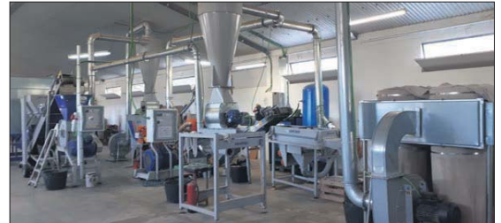
Planta de gestió de la biomassa.