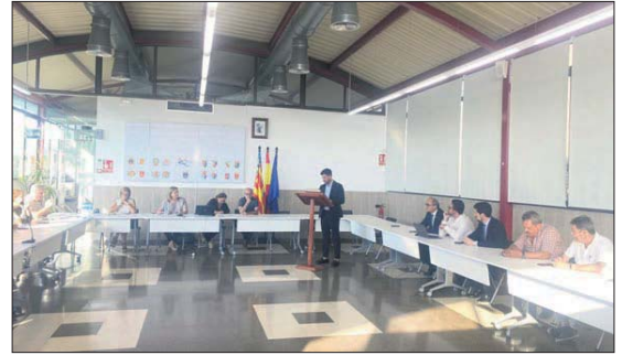
Pleno de la Mancomunitat del Camp de Túria.

El departamento de Bienestar Social y Sanidad de la Mancomunitat Camp de Túria es el que