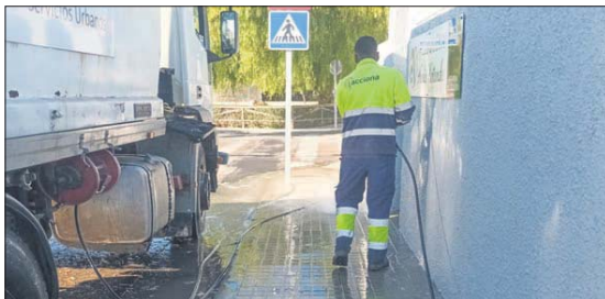
Un operario realizando tareas de limpieza.

Las frecuencias en área central mejorarán el barrido manual con