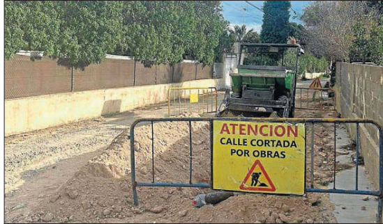
Obras en la urbanización El Romeral de Marines.