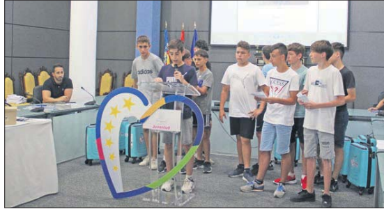
El proyecto Yepic acercará Europa a los jóvenes.

Este proyecto se suma a 'TRADITIONS2EU' que Benaguasil, que ha conseguido 20.000 euros, llevará a cabo