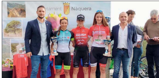
Entrega de trofeos de la carrera ciclista femenina.

La carrera, sobre un circuito de 70 kilómetros que ascendía en varias ocasiones el Alto de Canteiras, incorporó a las ciclistas cades y máster 40 y 50 en el primer paso por Nàquera, después de que las junior, elite/sub23 y máster 30 hubieran realizado la mitad del recorrido. La meta estaba ubicada en la ermita de Nàquera, que coronaba un durísimo repecho de más de 200 metros.