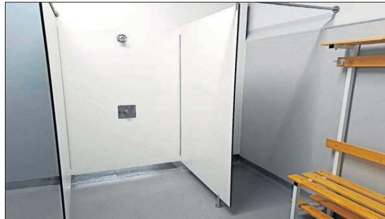
Nous vestuaris de les Escoles velles.

Els vestuaris s'obriran a la celebració de campionats esportius que es realitzen en les ma-