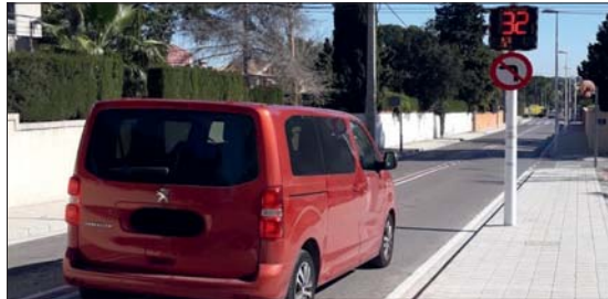
Radar informatiu de velocitat en l'Eliana.

D'altra banda, es millorarà la xarxa de sanejament i pluvials en 16 punts. En uns casos es tracta d'actuacions d'obra civil com augmentar o recreixer l'altura dels rastells de les voreres i en altres casos augmentar o modificar les canonades existents i augmentar els elements de drenatge. També es realitzaran obres per