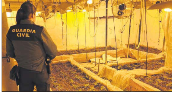
Agent de la Guardia Civil en la plantació de marihuana.

A més, en l'operació es van aprehendre més de 400 plantes de marihuana, 10.400 euros en bitllets fraccionats, 54 grams de marihuana, 24 grams d'haixix, 567 grams de cocaïna, una pisto-