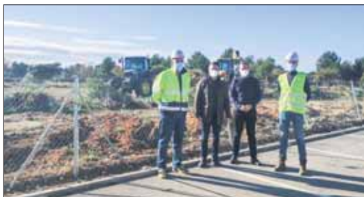
Visita al inicio de obras del nuevo colegio Mozart.

El nuevo centro educativo se construirá sobre una parcela de titularidad municipal de 11.000 metros cuadrados y contará con seis aulas de infantil, doce de primaria, un comedor y un gimnasio, que se dispondrán en dos plantas.