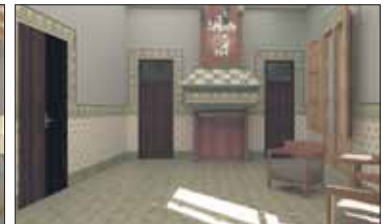
Recreació del projecte guanyador de la remodelació de la Casa Bernal.

tat amb 50.000 euros, 7.000 euros per la proposta i 43.000 euros per a la realització del projecte d'execució de l'obra.