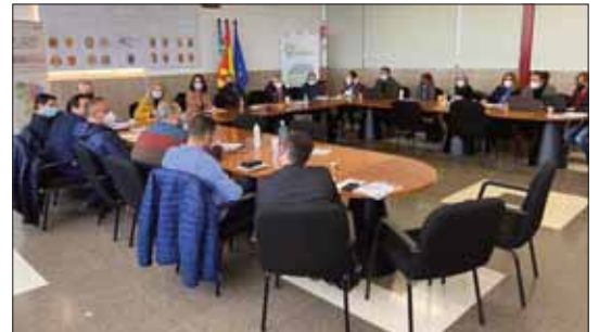
Comitè comarcal de polígons industrials.

Entre altres assumptes, s'ha posat sobre la taula la necessitat d'una eina que permeta conèixer les empreses existents de cadas-