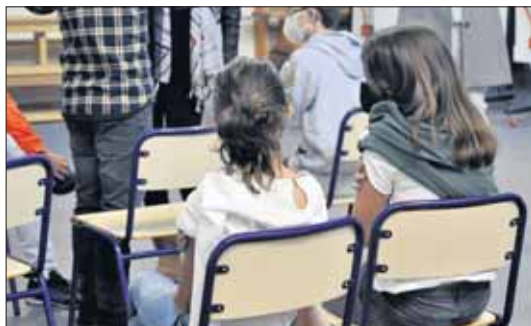
Alumnes vacunades en el col·legi Verge del Carme.

Abans del parèntesi nadalenc, els alumnes de quart, cinqué i sisé de Primària van rebre la