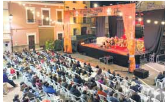
Representació del musical 'El Regne del Lleó'.

La representació de 'El Regne del Lleó', una obra tribut a 'El Rei Lleó' va entusiasmar a grans i xicotets amb la seua combinació de música, coreografies, llums i vídeo. La producció va aconseguir transpor-