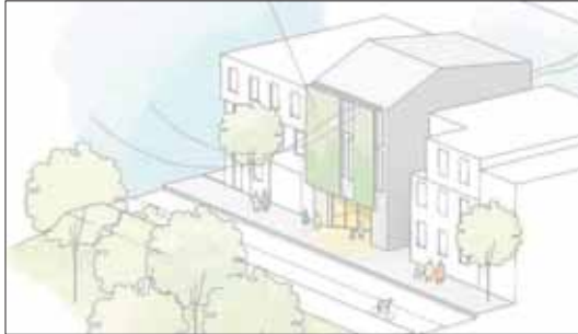
Imagen del proyecto de remodelación del Centro Cívico.

El edificio se ampliará con una planta más para albergar un museo con la colección de los