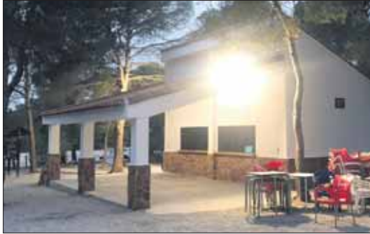
Bar de l'àrea recreativa de la Pedrera del Rei.

L'Ajuntament de Vilamarxant, a través de la regidoria de Medi Ambient, ha dut a terme les obres de reforma del bar situat en l'àrea recreativa per oferir un millor servei a tots els veïns i visitants que gaudeixen