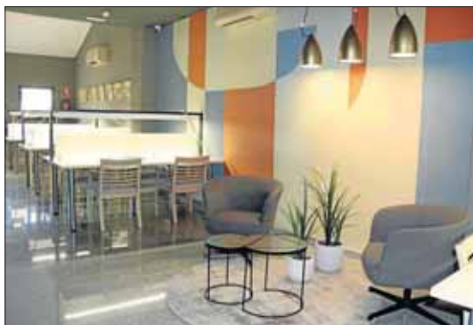
Remodelació de la sala d'estudi de la biblioteca.

Entre les actuacions realitzades, fonts municipals han destacat les millores en il·luminació, amb taules que inclouen llums led individuals i els nous punts