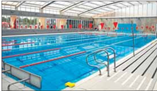
La piscina municipal permanece cerrada al público.

El plazo para la presentación de ofertas por parte de las em-