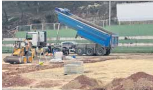
Treballs de remodelació del poliesportiu Héctor Catalá.

"Ampliem l'oferta esportiva del nostre poble amb aquesta tercera fase de les obres del Poliesportiu Municipal Héctor Catalá. L'any passat vam inaugurar el camp de futbol 8 de gespa artificial i en breu podrem gaudir d'unes noves pistes de pàdel i bàsquet molt