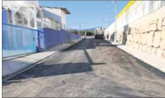
Obra de mejora del asfaltado en el polígono.

En concreto, el IVACE ha aportado una subvención de 143.545,20 euros y el Ayuntamiento de Marines ha financiado los 30.091,20 euros restantes para alcanzar la cifra total de 173.636,40 euros que se han invertido en esta zona del municipio de Camp de Túria.